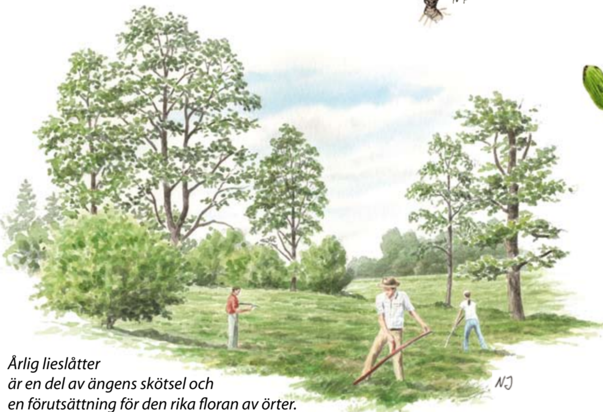
Årlig lieslätter är en del av ängens skötsel och en förutsättning för den rika floran av örter.