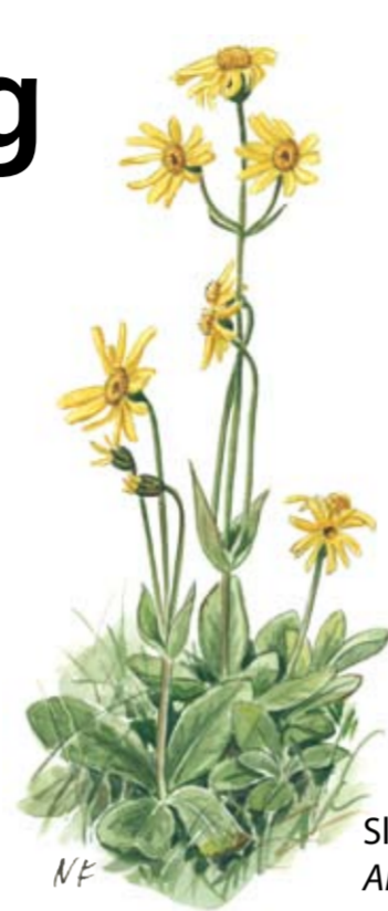
Slättergubbe Arnica montana

Biotopskyddsområdet Älgbosätter Lilläng bildades 2001 och är 2,2 hektar stort. Området ingår i EU:s ekologiska nätverk av skyddade områden, Natura 2000. Biotopskyddsområdet ägs av privata markägare och förvaltas av Länsstyrelsen Östergötland som kan nås på adress: 581 86 Linköping, eller telefon 013-19 60 00. Se också: lansstyrelsen.se/ostergotland