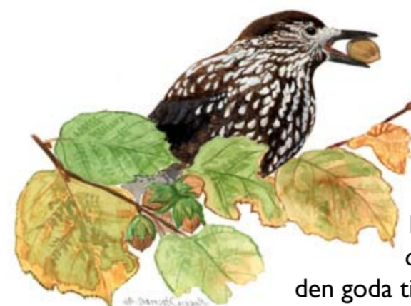
Nötkräkan Nucifraga caryocatactes lockas av den goda tillgången på hasselnötter.