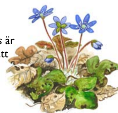
Blåsippa Hepatica nobilis är fridlyst och förbjuden att plocka och gräva upp.