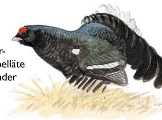
Orre Tetrao tetrix . Orrtuppens bubblande spelläte hörs från långt håll under stilla vårmorgnar.

Österby naturreservat – mitt i det Södertörnska sprickdalslandskapet, växer gammal barrskog med ett stort inslag av lövträd. Skogen har länge varit skonad från modernt skogsbruk och är därför hem för en lång rad sällsynta djur och växter. Reservatet, som är 132 hektar stort, bildades år 2006.