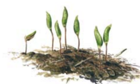
Grön sköldmossa Buxbaumia viridis - en sällsynthet på död ved.