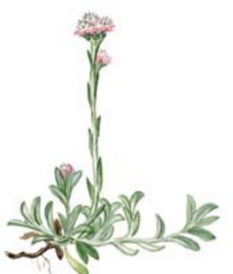
Kattfot Antennaria dioica