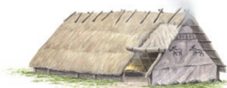
Hus från jägarstenåldern. Så här kan det också ha sett ut.

Du kan bitta de olika husens exakta läge genom de färgmarkeringar som gjorts i asfalten.