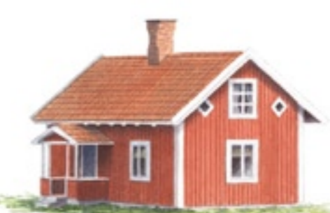
Trädgårdstorp som det såg ut år 2004.