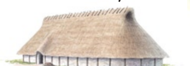
Långhus från bronsåldern för cirka 4000 år sedan.