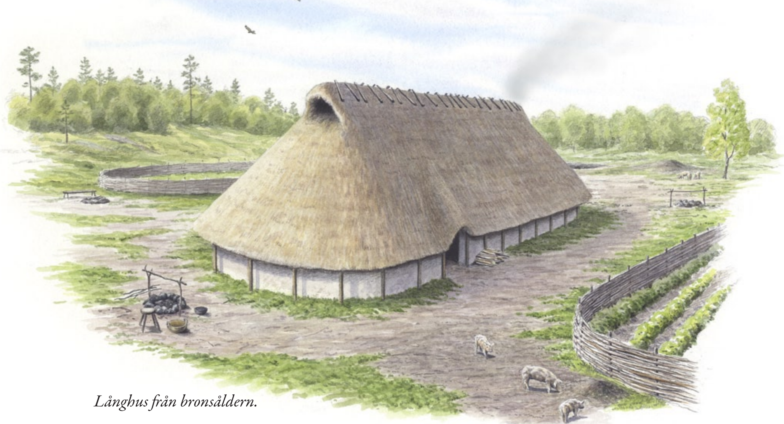
Långhus från bronsåldern.

Under tidig bronsålder brinner huset ner. Lämningarna vittnar om ett dramatiskt förlopp där delar av husväggen faller ut i riktning mot Malmenvägen. I och med det upphör bosättningen och förhistoriens människor flyttar från platsen. Kvar blir enstaka krukskärvor från lerkärl tillsammans med ett fåtal redskap av flinta. I marken syns endast de sotiga spåren av en forntida storgård.