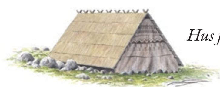
Hus från jägarstenåldern.