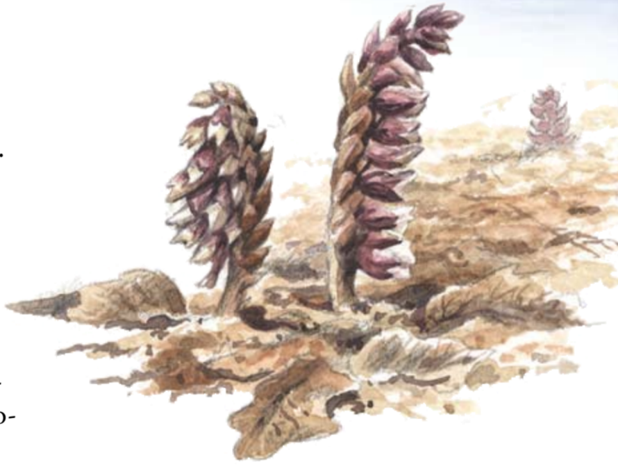
VÄTTEROS (LATHRAEA SQUAMARIA) LEVER SOM ROTPARASIT PÅ FRAMFÖRALLT HASSEL.

Reservatet ingår i Natura 2000, EU:s nätverk av värdefull natur. Marken i reservatet är privatägt. Reservatet förvaltas av Länsstyrelsen Östergötland. Adress: 581 86 Linköping, Telefon 013-19 60 00. Se också: www.e.lst.se