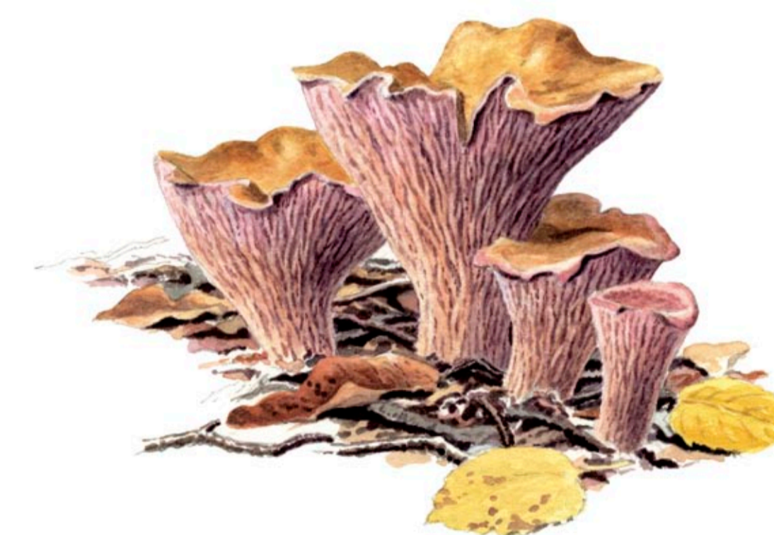
Violgubbe är en svamp som trivs i kalkrika skogsmarker.

Större delen av nationalparken består av skog. Skog som under lång tid har använts för huggning av ved till träkol, ved och virke för husbehov. Skogen fungerade också som betesmark för gårdens boskap. Under 1800-talets senare del högs nästan all skog ner. Virket blev troligen kolved till Garphytte bruk, som vid denna tid behövde stora mängder träkol i sin järnhantering. Här och var i parkens skog kan man fortfarande hitta rester efter kolmilor i form av kolbottnar. På den i stort sett kalhuggna marken sådde man sedan med framförallt granfrön. En viss gallring har skett i skogen efter 1940-talet. Idag får skogen utvecklas fritt för att med tiden resultera i en skog med olika trädarter, gamla och döda träd. En skog där många av dagens hotade växter, djur och svampar trivs.