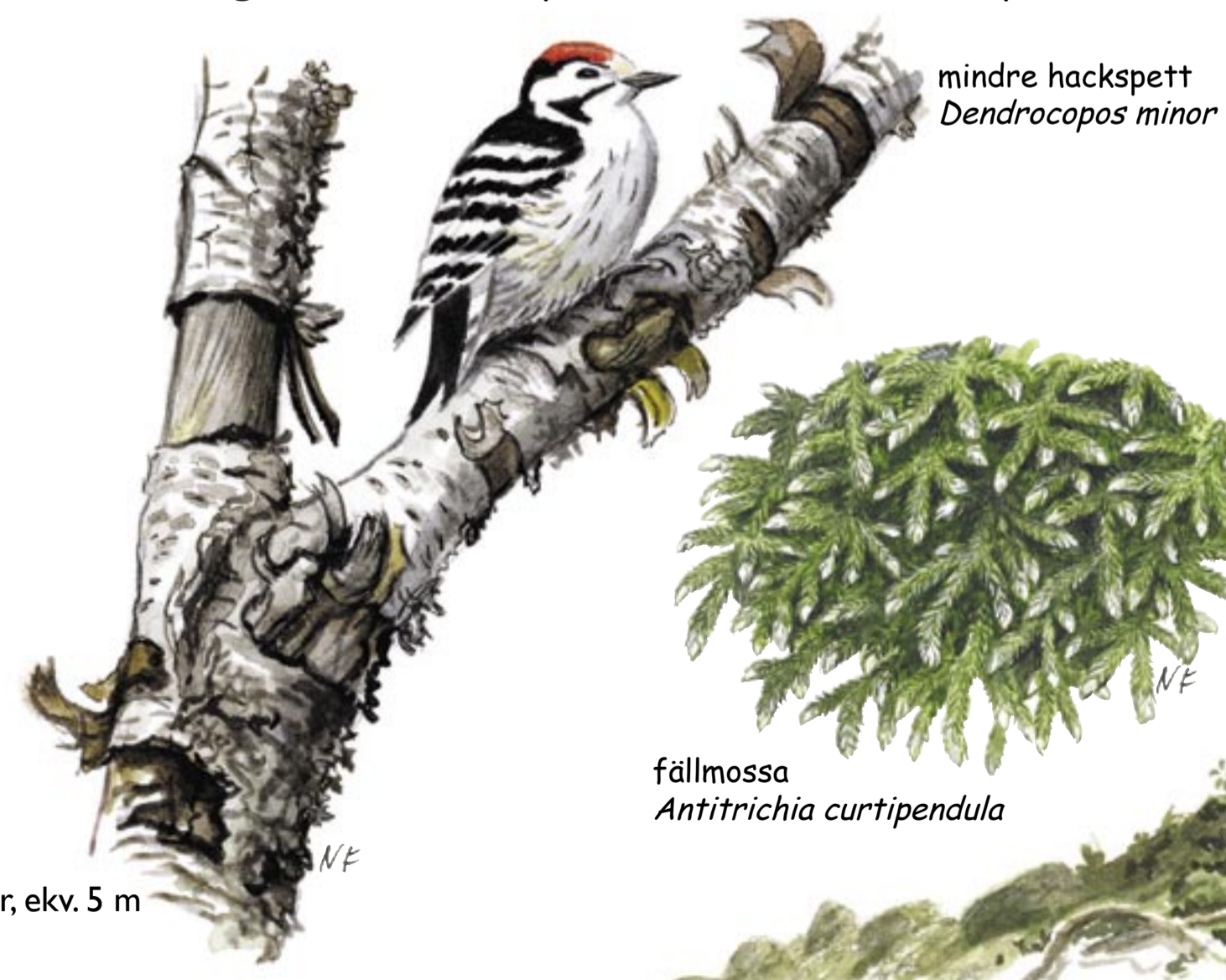
mindre hackspett Dendrocopos minor