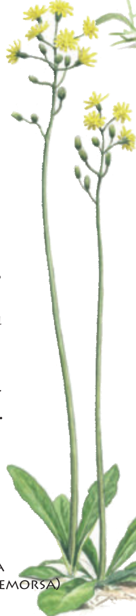
KLASEFIBBLA (CREPIS PRAEMORSA)