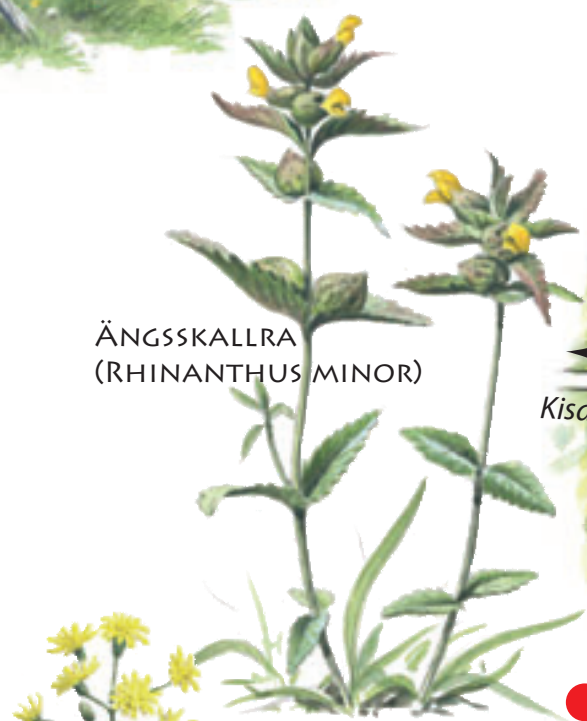
ÄNGSSKALLRA (RHINANTHUS MINOR)

Ängen brukades genom traditionell slätter in på 1950-talet. Efter en tid som betesmark återupptogs slätten 1976. Idag sköts ängen av ideella krafter. Under våren städas ängen från löv och kvistar för att underlätta slätten, som sker i mitten av juli. Hamlingen av askarna sker i augusti. Under en period efter slätten betas ängen av nötkreatur.