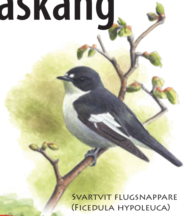
SVARTVIT FLUGSNAPPARE (FICEDULA HYPOLEUCA)

Misterfalls askäng är ett levande fornminne. Ängen har förmodligen slagits med lie allt sedan de första bönderna bosatte sig här, troligtvis under tidig medeltid. Tack vare den traditionella skötseln har ängen en fantastisk rikedom på växter, men också insekter såsom fjärilar.