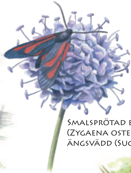
SMALSPRÖTAD BASTARDSVÄRMARE (ZYGAENA OSTERODENSIS) PÅ ÄNGSVÄDD (SUCCISA PRATENSIS).