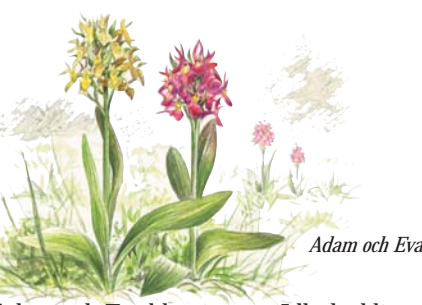
Adam och Eva

Vandringsleden är svårtillgänglig men från grusvägen genom byn kan man uppleva en del av odlingslandskapet. Det finns möjlighet att komma ut i en vacker hagmark på en gammal körväg. Åk då till ladugården och parkera där. Öppna sedan den tunga grinden bortom ladugården där körvägen börjar.