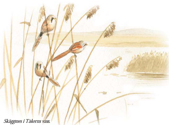
Skägges i Takerns vass.

Slätten i västra Östergötland vilar på en kalkrik berggrund, helt olik det dominerande urberget som bygger upp landskapet i övrigt. Kalken sätter sin prägel på vegetationen, i vått