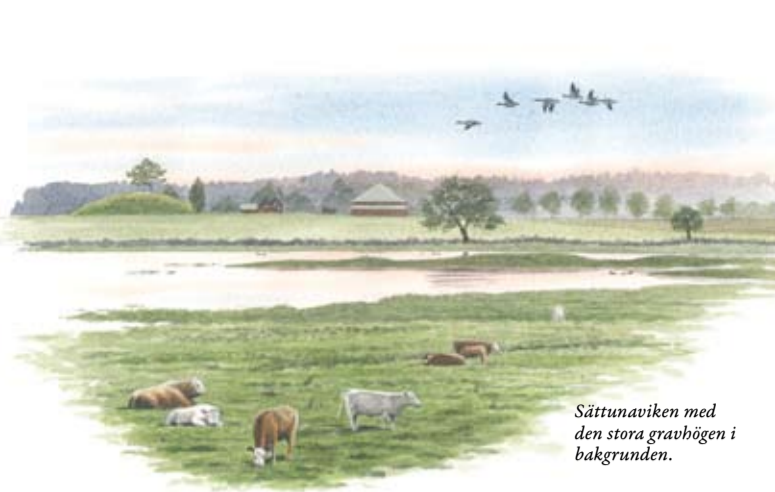
Sättunaviken med den stora gravhögen i bakgrunden.