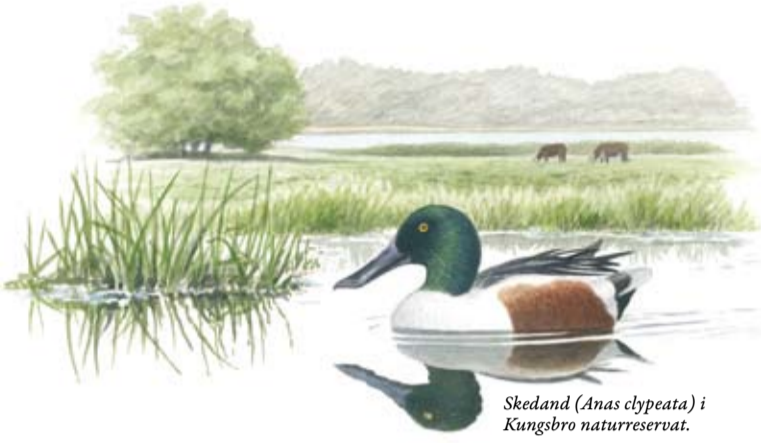
Skeedand ( Anas clypeata ) i Kungsbro naturreservat.

Norra delen av reservatet ligger i sluttningen upp mot skogsbygden och utgörs av en större ekhagmark. Här växer en artrik flora av typiska hagmarksväxter som ängsskallra, brudbröd, korskavall, solvända och nattviol. Många av de vidkroniga ekarna är grova med en stamdiameter över en meter. Ekbarken hyser en mångfald av lavar, bland dem krävande arter som hjalmbroskav, rosa skärelev och gul dropplav.