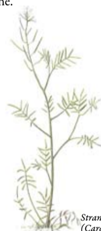
Strandbräsma ( Cardamine parviflora )

I den täta vassen där utanför bygger brun kärrhök sitt bo. Här bor rörsångare, trastsångare, sävsparv, sothöna, vattenrall och röddrom. Mer ovanliga fåglar som regelbundet förekommer i Västra Roxens våtmarker är småfläckig sumphöna, kornknarr, storspov, dvärgmåsa, svarttärna och jorduggla.