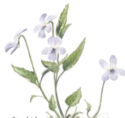
Strandviol ( Viola persicifolia )

Det öppna strandängslandskapet uppskattas av vadarfåglar som tofsvipa och rödbena vilka häckar här, men också av förbiflyttande arter som grönbena, svartsnäppa, glutt-snäppa och brushane. I maj under vårflyttningen kan man få se brushanespel vid Svartåmynningen. Strandängarnas mest kräsna invånare är rödspoven som här har en av få häckningsplatser på fastlandet norr om Skåne.