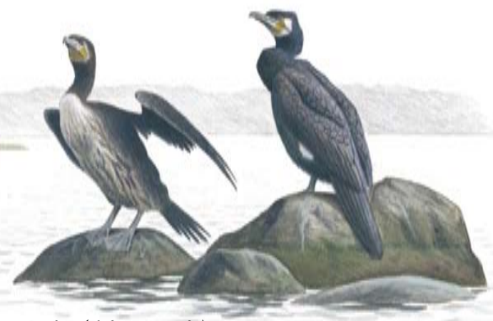
Storskarv ( Phalacrocorax carbo )