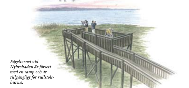
Fågeltornet vid Nybrobaden är försett med en ramp och är tillgängligt för rullstolsburna.

Besöksområdet vid Nybrobaden har anpassats för att öka tillgängligheten för rörelsehindrade. Fågeltornet har en ramp för rullstolar, barnvagnar etc. och i anslutning till tornet finns ett dass tillgängligt för rullstolsburna. Rörelsehindrade har möjlighet att parkera närmare tornet än övriga besökare.