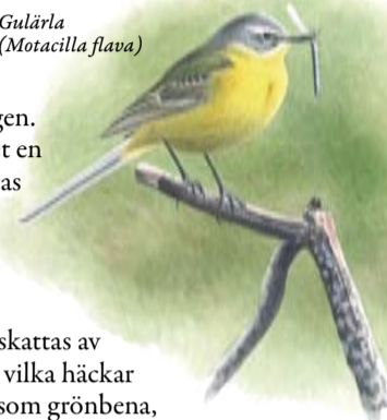
Gulärta ( Motacilla flava )

Gulärta är en annan av strandängarnas verkliga karaktärsfåglar och dit får också räknas grågås och kanadagås som i stora flockar betar på de öppna gräsmarkerna. Gässen gynnas av att kreaturen håller vegetationen lågvuxen samtidigt som de själva bidrar till att ytterligare skärpa betestrycket.