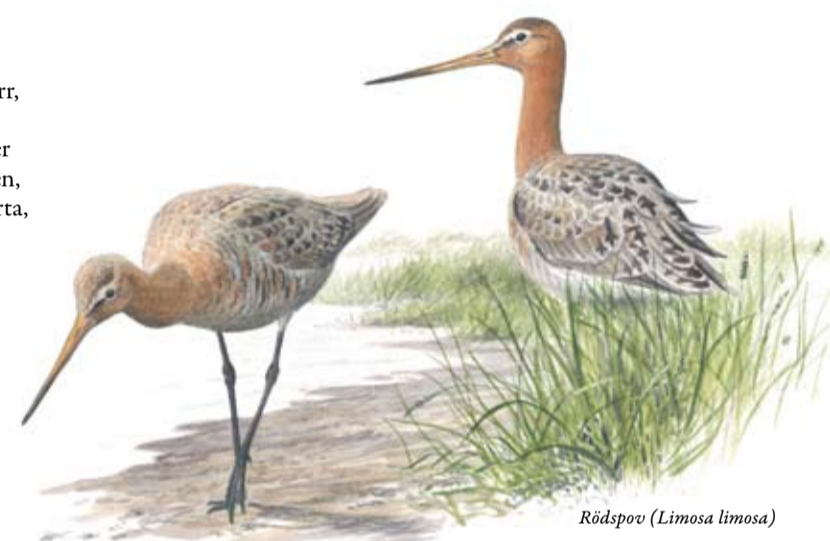
Rödspov ( Limosa limosa )

Successivt har strandängarna restaurerats och idag sker skötseln både genom slåtter och bete, vilket också gäller Kungsbro naturreservat, bildat 1996. Efter restaureringen ökade antalet häckande rödbenor, tofsvipor och gulärlor och som kronan på verket återkom rödspoven som häckfågel vid Svartåmynningen.