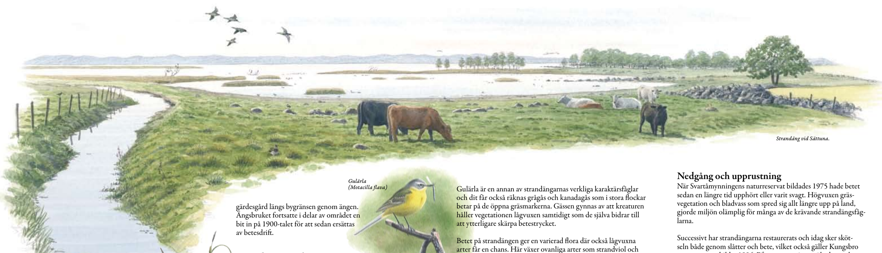
Strandäng vid Sättuna.