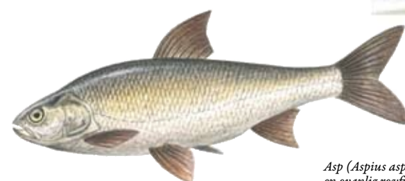
Asp ( Aspius aspius ), en vanlig rovfisk.

Under 1990-talet har fiskbeståndet i Roxen förändrats. Exempelvis har norsen minskat kraftigt, liksom antalet stora fiskätande abborrar. Den vetenskapliga dokumentationen av förändringarna och kunskapen om orsaken är tyvärr bristfälliga.