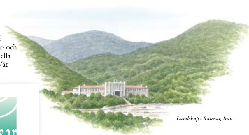
Landskap i Ramsar, Iran.

Våtmarkskonventionen var den första globala överenskommelsen om naturvård. Det är också den enda som omfattar en hel naturtyp. Nya länder har tillkommit under årens lopp och idag har cirka 150 länder anslutit sig till konventionen. Våtmarkskonventionen har ett kansli i Schweiz och vart tredje år hålls ett möte för alla deltagande länder och organisationer.