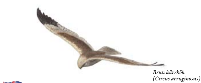
Brun kärrhöök ( Circus aeruginosus )

Det kan vara svårt att hitta till Stångåns mynning och det bästa är att skaffa en stadskarta. Stångåstråket är ett välutnyttjat närströvsområde. Till fots eller med cykel går det att följa ån på nära håll hela vägen ut ur staden. Med bil kommer du inte intill ån på samma sätt, men du kan åka ut till fågeltornet vid mynningen.