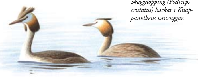
Skäggdopping (Podiceps cristatus) häckar i Knäppanvikens vassruggar.

Under våren bokstavligen kokar de strandnära kärren av lekande grodor. Parningsmogna grodor och paddor uppför en märklig symfoni av knarrande och puttrande läten. I kärren leker också mindre vattensalamander. Efter parningen flyttar salamandrar liksom grodor och paddor upp på land.