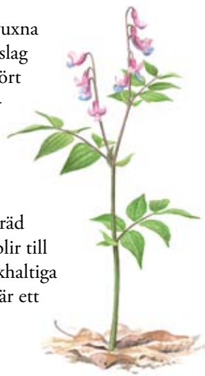
Vårärt ( Lathyrus vernus ) växer i lövskogen.

I södra delen av reservatet växer en drygt hundra år gammal lövsumpskog. Här står döda träd kvar som högstubbar eller faller till marken och blir till s.k. lågor. Gamla lövträd i kombination med kalkhaltiga källor är en mycket ovanlig och värdefull miljö där ett stort antal sällsynta mossor, lavar, skalbaggar och snäckor lever. I Sjöbo-Knäppans sumpskog finns sällsynta arter med fantasieggande namn som fetbålmossa, grå vårtlav och blåoxe.