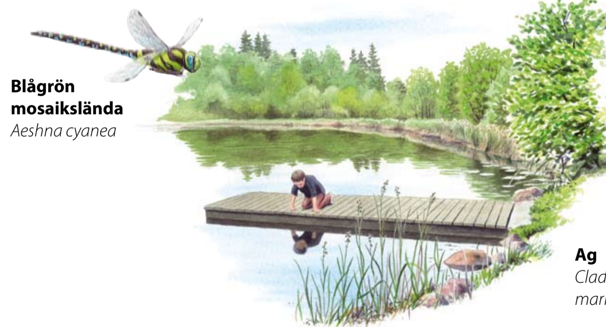
Blågrön mosaikslända Aeshna cyanea

Kulturhistoria - Det är människan som under århundraden format det småskaliga kulturlandskapet runt Staffanstorp genom odling, betesdrift och slätter. Det äldsta spåret av mänsklig aktivitet i området är en treudd - en trekantig stenformation som markerar en begravningsplats från äldre järnåldern. I reservatet finns även många stenrösen, äldre husgrunder, fornåkrar och rester av en kalkugn.