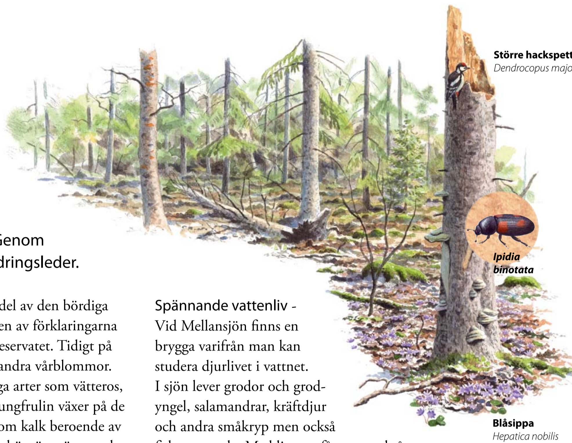
Större hackspett Dendrocopus major

Om våren blommar lungört Pulmonaria obscura tillsammans med stora mängder blåsippor och vårlök.