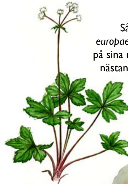
Sårläk Sanicula europaea känns igen på sina mörkt gröna, nästan läderartade, flikiga blad.