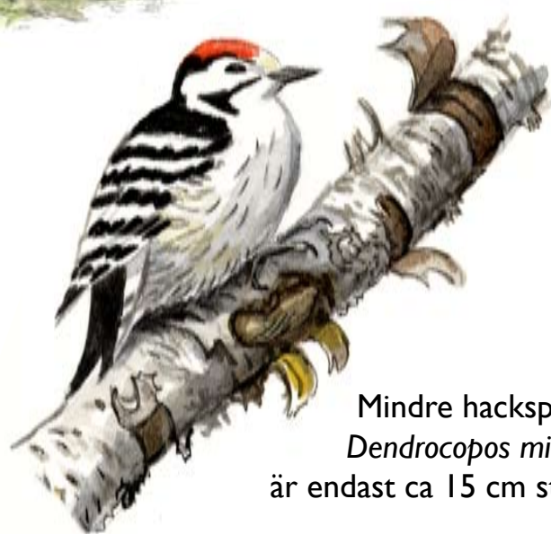
Mindre hackspett Dendrocopos minor är endast ca 15 cm stor.