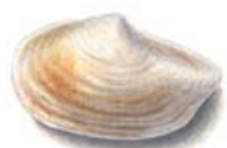
Portlandia (Yoldia) arctica